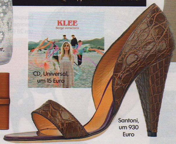
Santoni, um 930 Euro