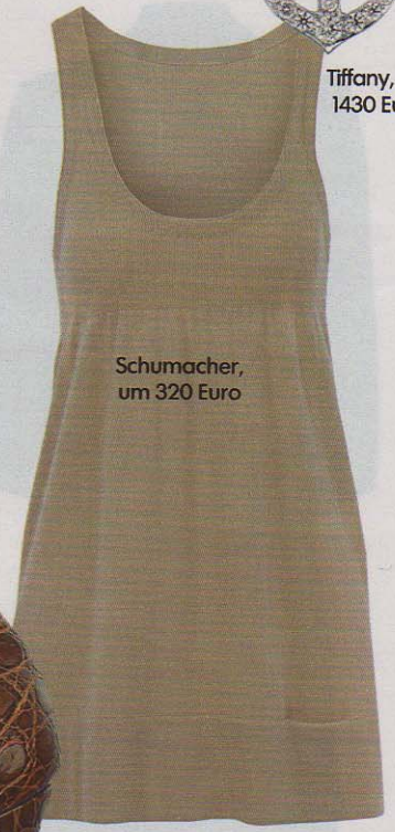
Schumacher, um 320 Euro