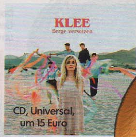
CD, Universal, um 15 Euro