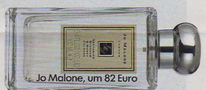
Jo Malone, um 82 Euro