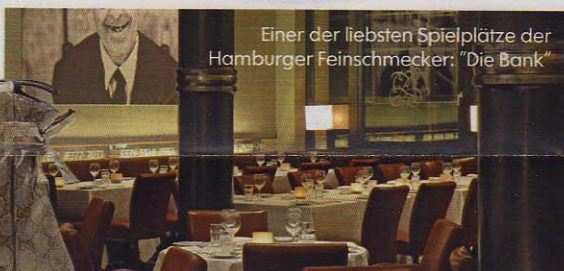
Einer der liebsten Spielplätze der Hamburger Feinschmecker: "Die Bank"