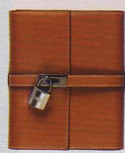
Hermès, um 880 Euro