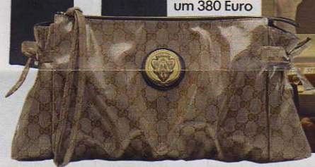
Gucci, um 380 Euro