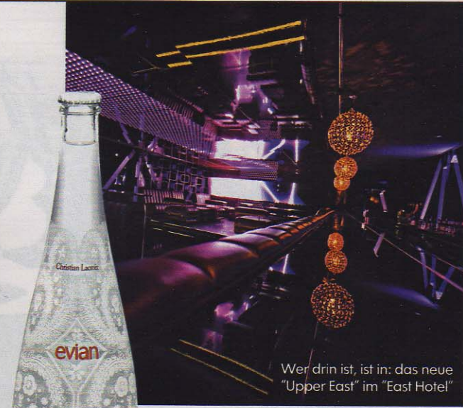
Wer drin ist, ist in: das neue "Upper East" im "East Hotel"