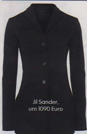
Jil Sander, um 1090 Euro