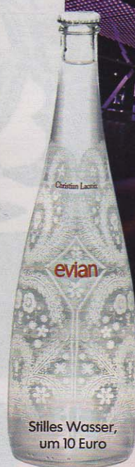
Stilles Wasser, um 10 Euro